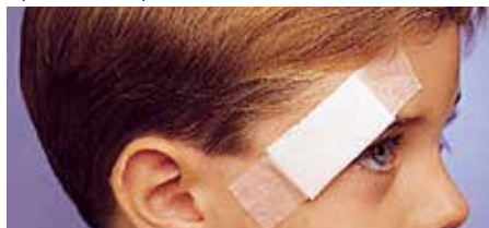
Фиксиране на раневи превръзки