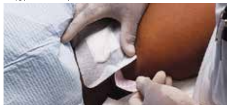
Превръзка на аксиларен абсцес