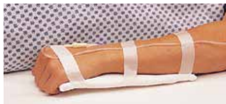
Шина на ръката