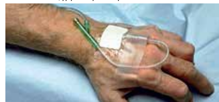
фиксиране на i.V системи