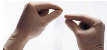
Лесна за късане, дори и с ръкавици

Прозрачна, перфорирана лепенка на синтетична основа, лесна за откъсване, надеждна при фиксиране на превръзки