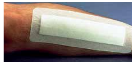
Превръзка на хирургична рана

Мека, адхезивна превръзка от нетъкан текстил