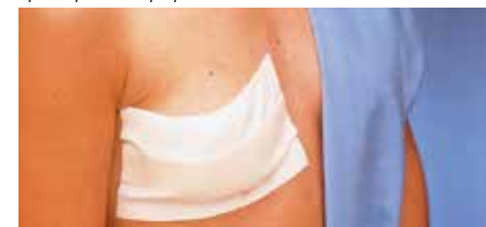
Превръзка при мастектомия