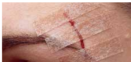
Затваряне на рани под ниско напрежение

Клинично доказаните лепенки Steri-Strip предлагат бързо и ефективно затваряне на рани