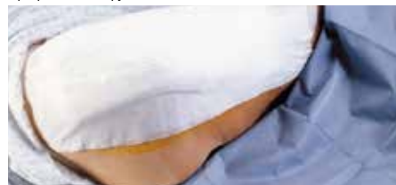
Превръзка на бедрото