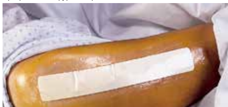
Превръзка на хирургична рана