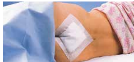
Превръзка на сакрума