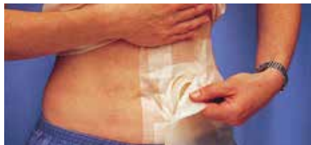
Торбичка за стомирани