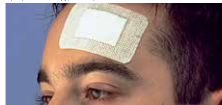
Стерилна превръзка за първа помощ