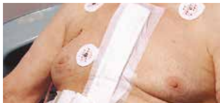
Jackson-Pratt и системи

Мултифункционална, икономична лепенка на хартиена основа