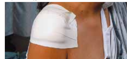
Кръгла раменна превръзка