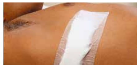
Превръзка на торакотомия