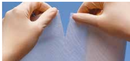
Перфорирана - лесна за откъсване

Мека, деликатна, гъвкава лепенка, лесна за употреба и поставяне върху кожата