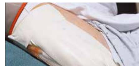
Превръзка на бедро

Много гъвкава, еластична лепенка на синтетична основа, разтеглива при нужда от компресия или от фиксиране на превръзки върху неудобни места