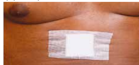
Превръзка при лапаротомия