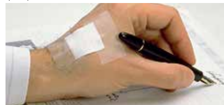
Фиксиране на раневи превръзки