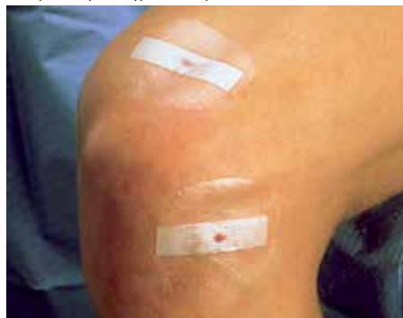
Система за затваряне на рани