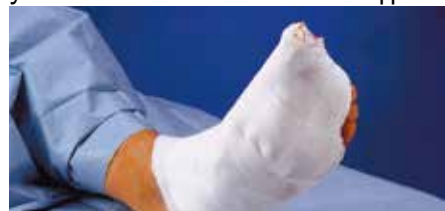
Превръзка при екзимия на тофи на палеца на крак

Мека, гъвкава лепенка както при стандартната Medipore™ лепенка, но с увеличена мекота и засилена адхезия