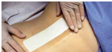
Превръзка на хирургична рана

Прозрачна превръзка с абсорбираща подложка