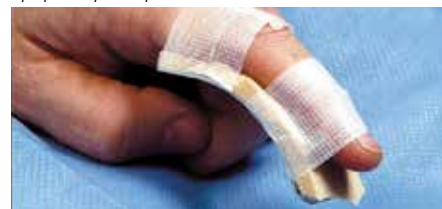
Шиниране на пръст